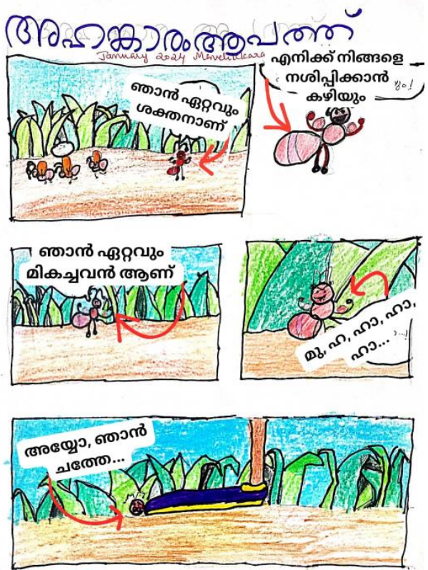
വര - ഇശ്വർ ഹരി

ഒരു സൺഡേ ഞാനും അമ്മയും പപ്പയും കുടി ആലപ്പുഴയിൽ പപ്പയുടെ കുട്ടുകാരനെ കണ്ടതിനുശേഷം ആലപ്പുഴ ബീച്ചിലേക്ക് പോയി. അവിടെ നാവികസേനയുടെ ഉപയോഗശൂന്യമായ ഒരു കപ്പൽ കാഴ്ചക്കാർക്ക് വച്ചിരുന്നു. ഒരു യുദ്ധക്കപ്പൽ കണ്ട ആശ്ചര്യത്തിൽ ആയിരുന്നു ഞാൻ. അവിടെനിന്ന് ഞങ്ങൾ കുറെ ഫോട്ടോസ് എടുക്കുകയും ചെയ്തു. എല്ലാവരും കപ്പലിന്റെ അടുത്ത് നിന്ന് ഫോട്ടോസ് എടുക്കാൻ ഉള്ള ആവേശത്തിൽ ആയിരുന്നു. കടലിൽ കളിക്കാനായി ഞാൻ അങ്ങോട്ടേക്ക് ഓടി. കുറേനേരം കളിച്ചു. അതിനുശേഷം പപ്പ എനിക്ക് ഐസ്ക്രീം വാങ്ങിച്ചു തന്നു. അത് കഴിച്ചു, ബീച്ചിന്റെ ഒരു ഭാഗത്തു മറൈൻ ഫെസ്റ്റിനുള്ള ഒരുക്കങ്ങൾ നടക്കുകയായിരുന്നു. വീണ്ടും ഞാൻ കടൽത്തീരത്ത് ചെന്ന് എൻറെ പേര് എഴുതി അത് തിരമാല വന്ന് മായ്ക്കുന്നത് നോക്കി നിന്നു പോയി. അപ്പോഴേക്കും നേരം ഇരുട്ടിത്തുടങ്ങി. ഒട്ടും താമസിയാതെ ഞങ്ങൾ തിരിച്ചു വീട്ടിലേക്ക് പോയി.