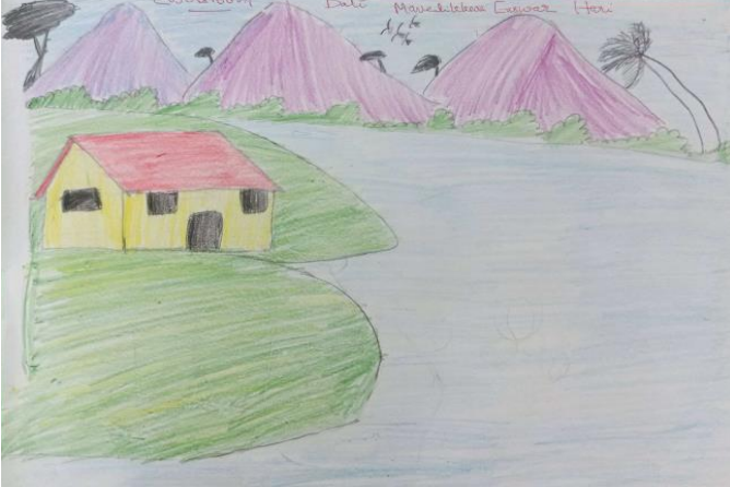
വര: ഇശ്വർ ഹരി