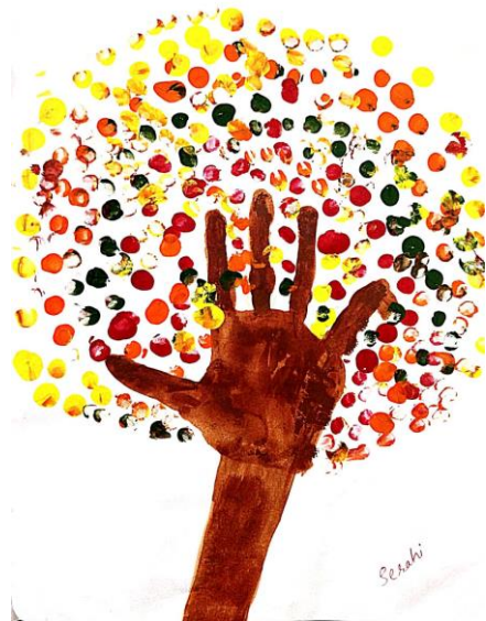
വര: സെറാഹി എസ് വള്ളക്കാലിൽ